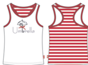
113 00 BB G 1002 Майка (95% хлопок, 5% эластан) 190 р.