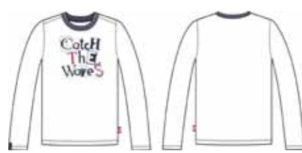
113 00 ВВ В 1202 Футболка (95% хлопок, 5% эластан) 280 р.