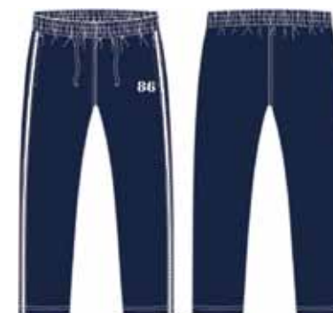
113 00 ВВ В 5601 Брюки (95% хлопок, 5% эластан) 480 р.