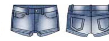
113 00 BB G 6001 Шорты (100% хлопок) 390 р.