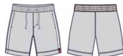
113 00 ВВ В 5401 Шорты (100% хлопок) 250 р.