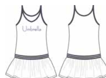
113 00 BB G 5102 Сарафан (100% хлопок) 310 р.