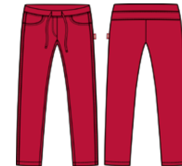
113 00 BB G 5602 Брюки (95% хлопок, 5% эластан) 480 р.