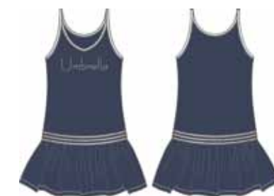
113 00 BB G 5101 Сарафан (100% хлопок) 310 р.