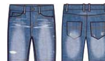
113 00 ВВ В 6001 Шорты (100% хлопок) 390 р.