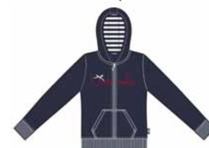
113 00 BB G 1901 Жакет (95% хлопок, 5% эластан) 680 р.