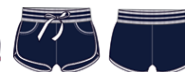
113 00 BB G 5402 Шорты (100% хлопок) 250 р.