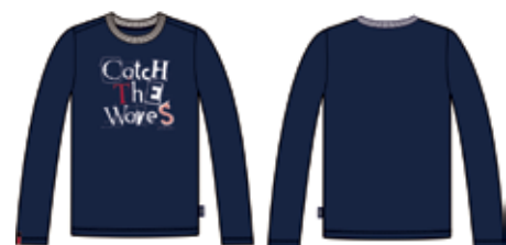
113 00 ВВ В 1201 Футболка (95% хлопок, 5% эластан) 280 р.