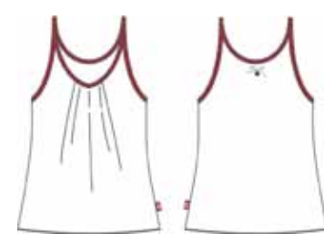
113 00 BB G 1102 Топ (95% хлопок, 5% эластан) 160 р.