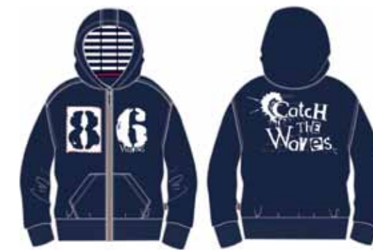
113 00 ВВ В 1602 Толстовка (95% хлопок, 5% эластан) 680 р.