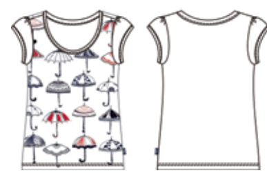
113 00 BB G 1204 Футболка (95% хлопок, 5% эластан) 240 р.