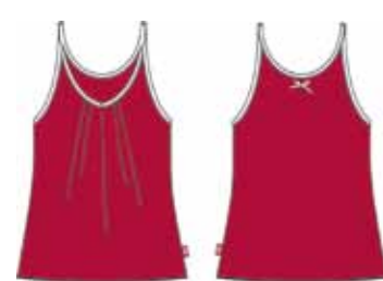
113 00 BB G 1101 Топ (95% хлопок, 5% эластан) 160 р.