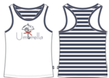
113 00 BB G 1001 Майка (95% хлопок, 5% эластан) 190 р.