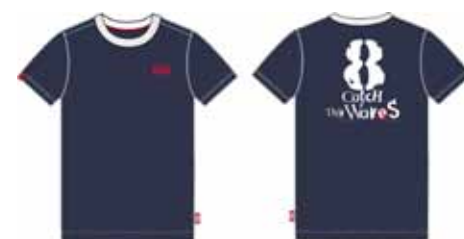
113 00 ВВ В 1206 Футболка (95% хлопок, 5% эластан) 240 р.