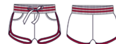
113 00 BB G 5401 Шорты (100% хлопок) 250 р.