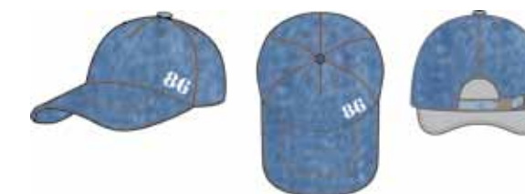
113 00 ВВ В 7101 Бейсболка (100% хлопок) 170 р.