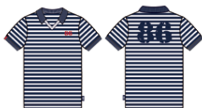
113 00 ВВ В 1203 Футболка (100% хлопок) 280 р.