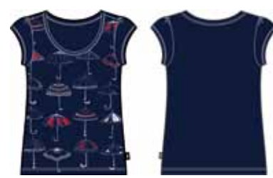
113 00 BB G 1203 Футболка (95% хлопок, 5% эластан) 240 р.