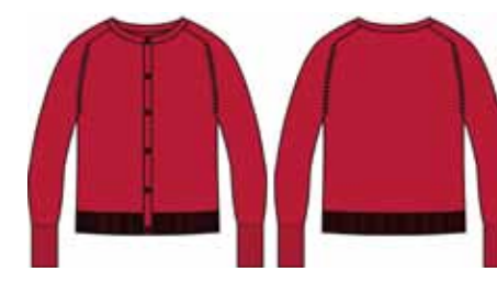
113 00 BB G 3602 Жакет (100% хлопок) 470 р.