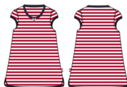
113 00 BB G 1502 Туника (95% хлопок, 5% эластан) 290 р.