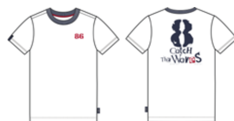
113 00 ВВ В 1205 Футболка (95% хлопок, 5% эластан) 240 р.