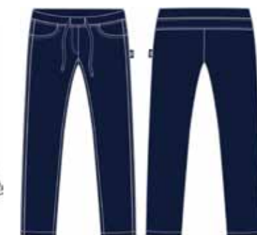
113 00 BB G 5601 Брюки (95% хлопок, 5% эластан) 480 р.