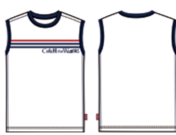
113 00 ВВ В 1003 Майка (95% хлопок, 5% эластан) 210 р.