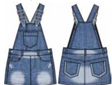
113 00 BB G 2601 Сарафан (100% хлопок) 530 р.