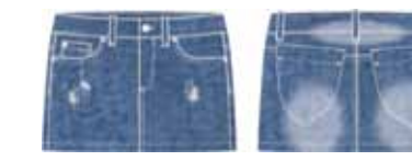
113 00 BB G 6101 Юбка (100% хлопок) 390 р.