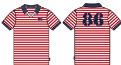
113 00 ВВ В 1204 Футболка (100% хлопок) 280 р.