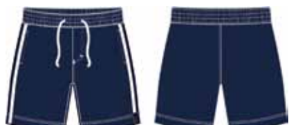
113 00 ВВ В 5402 Шорты (100% хлопок) 250 р.