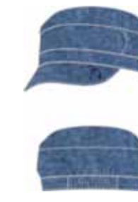
113 00 BB G 7101 Кепка (100% хлопок) 170 р.