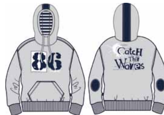
113 00 ВВ В 1601 Толстовка (95% хлопок, 5% эластан) 680 р.