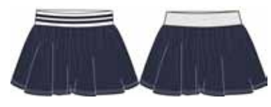
113 00 BB G 5501 Юбка (100% хлопок) 250 р.