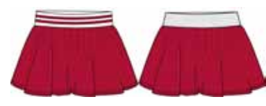
113 00 BB G 5502 Юбка (100% хлопок) 250 р.