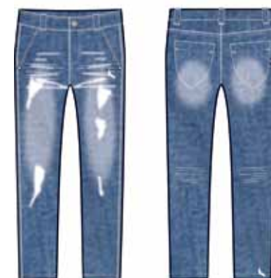
113 00 BB G 6301 Брюки (100% хлопок) 490 р.