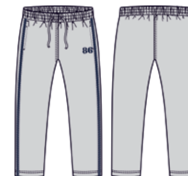
113 00 ВВ В 5602 Брюки (95% хлопок, 5% эластан) 480 р.