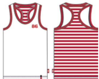
113 00 ВВ В 1001 Майка (95% хлопок, 5% эластан) 190 р.