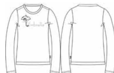
113 00 BB G 1202 Футболка (95% хлопок, 5% эластан) 280 р.