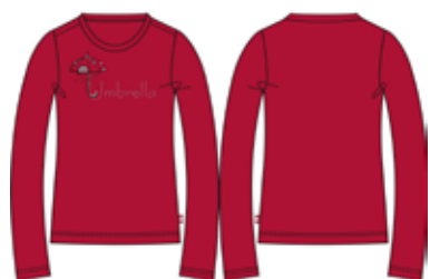
113 00 BB G 1201 Футболка (95% хлопок, 5% эластан) 280 р.