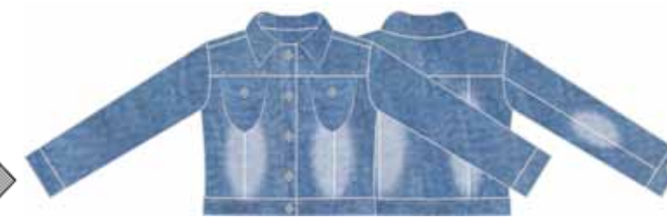
113 00 BB G 4101 Куртка (100% хлопок) 530 р.