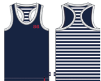
113 00 ВВ В 1002 Майка (95% хлопок, 5% эластан) 190 р.