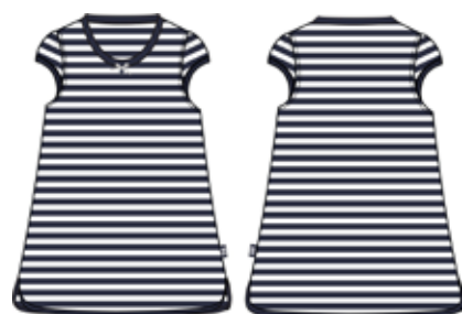
113 00 BB G 1501 Туника (95% хлопок, 5% эластан) 290 р.