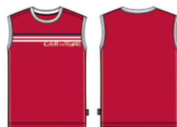
113 00 ВВ В 1004 Майка (95% хлопок, 5% эластан) 210 р.