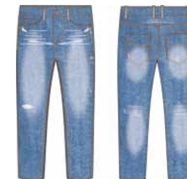
113 00 ВВ В 6301 Брюки (100% хлопок) 490 р.